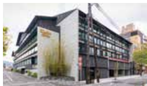
ソラリア西鉄ホテル京都プレミア-三条鴨川-