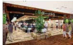
大橋西鉄名店街リニューアルイメージ