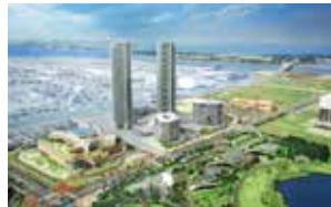
アイランドシティ複合開発イメージ